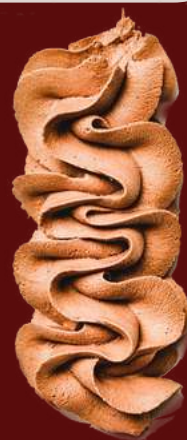
Chantilli de chocolate